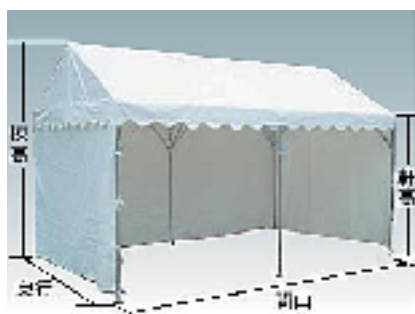
※写真は横幕がついたイメージです